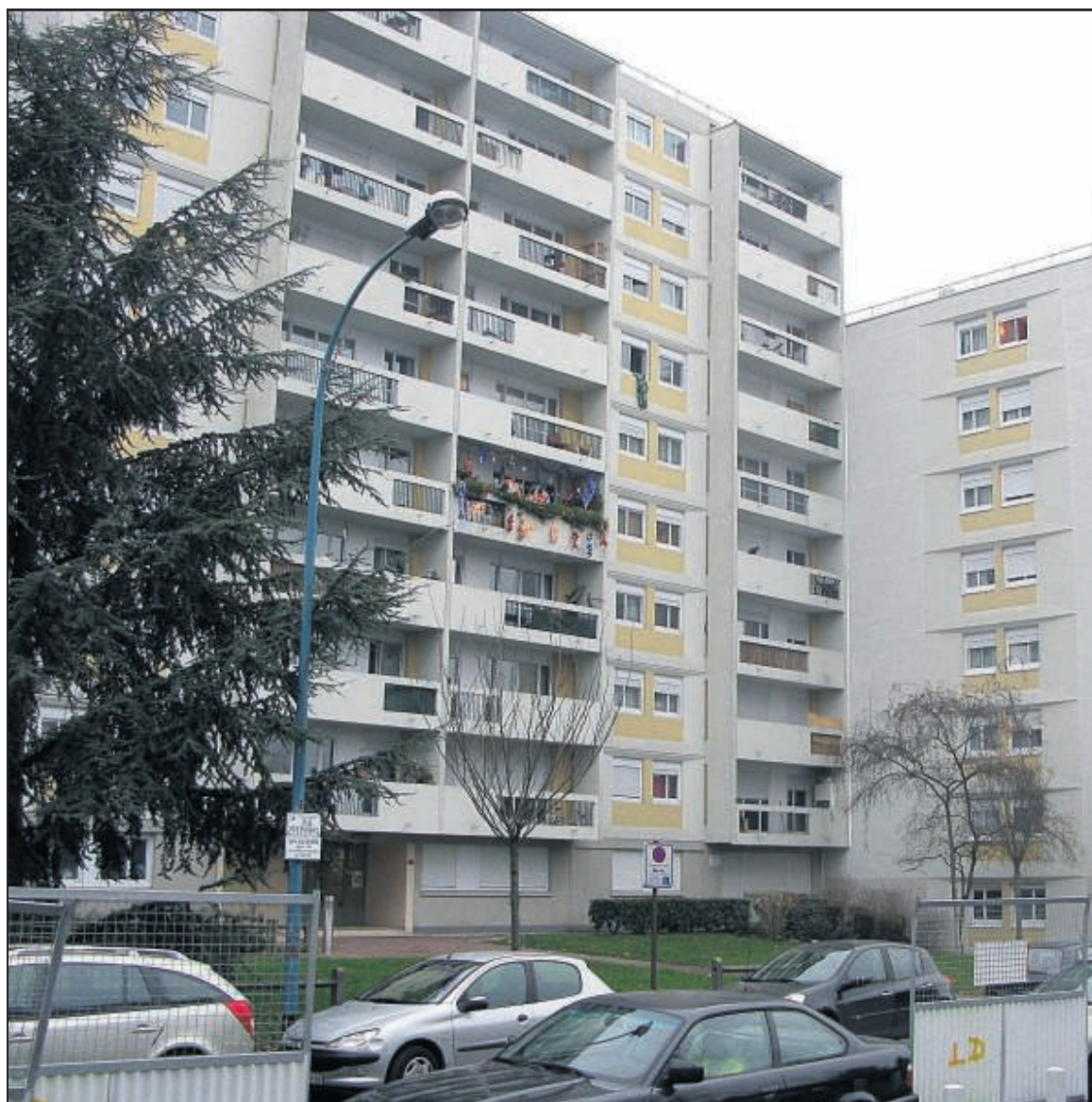
FONTENAY-SOUS-BOIS, HIER. C'est dans ces immeubles de logements sociaux, les 17 Henriettes, que va être pratiqué le surloyer vivement contesté par les locataires. (LP/V.V.)

Le bailleur, la Semidep, a estimé que sur son patrimoine concerné, 2 000 logements en Ile-de-France, 99 personnes devront assumer un surloyer. Ils sont moins d'une trentaine pour le moment. « Nous avons commencé notre campagne d'information sur le surloyer il y a un mois,