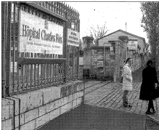
IVRY. Le projet de pôle d'excellence géronto-technologique de l'hôpital Charles-Foix est soutenu notamment par le Fonds européen de développement régional et le Fonds social européen. (L.P./C.M.)

Pour effectuer des études sur le vieillissement, une animalerie hébergeant des rongeurs sera également installée, permettant de suivre l'évolution d'animaux âgés. Ce pôle « allongement de la vie » ambitionne d'être à la fois un lieu de recherche, de formation et de développement économique. Liée à ce pôle, une pépinière d'entreprises (start-up de biotechnologies et d'informatique, industries pharmaceutiques...) sera ainsi implan-